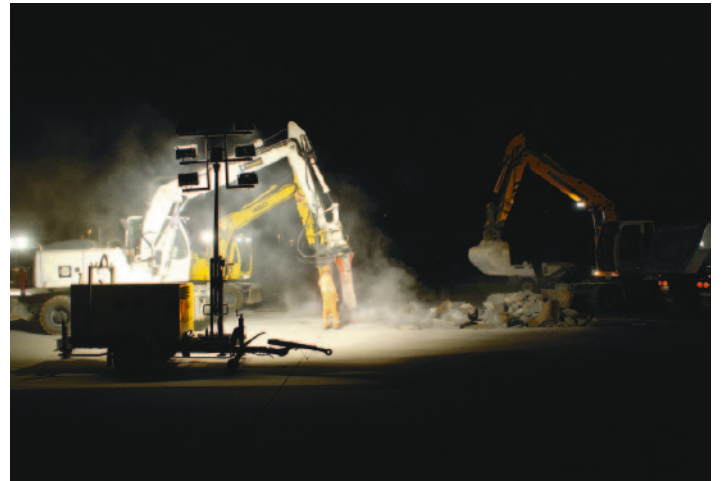
Abbruch während der Nachtpausen auf der Piste

Der Flughafen Zürich hat drei Start- und Landebahnen, die in einem Dreieck angeordnet sind. Durch die verschiedenen Anflugszenarien benötigt der Flugbetrieb alle drei Pisten. Aus diesem Grund können Instandsetzungsarbeiten an den Pisten nur in der Nacht ausgeführt werden. Seit über 20 Jahren werden einzelne Kleinflächen mit schnell erhärtendem Beton erneuert. Vor rund 10 Jahren begann man mit dem Ersatz ganzer Platten. Heute werden pro Nacht bis zu sechs Platten ( 6 \times 6 \times 0,37 m) ersetzt. Pro Jahr werden in den Sommermonaten zirka 1\,200\text{ m}^3 Schnellbeton verbaut, was einer Anzahl von bis zu 100 Einzelplatten entspricht. Der Schnellbeton benötigt eine Mindest-Frischbeton-Temperatur von 21^\circ Celsius, damit eine Frühfestigkeit von 20\text{ N/mm}^2 innerhalb 150 Minuten erreicht wird. Daher können diese Arbeiten nur in den Sommermonaten ausgeführt werden. Nach 24 Stunden erreicht der Beton eine Druckfestigkeit von zirka 55\text{ N/mm}^2 und eine Biegezugfestigkeit von 5,5\text{ N/mm}^2 . Der Plattenersatz wird im Bereich der Hauptbelastungen (Pistenmitte) der Flugzeuge ausgeführt.