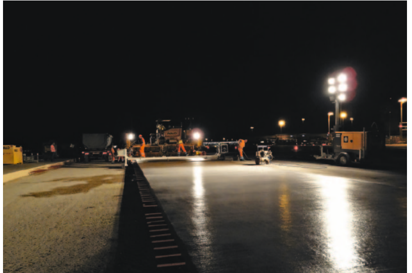
Maschinelles Betoneinbau mit Gleitschalungsfertiger

wenn immer möglich, flächige Sanierungs- oder Neubaubereiche ausgeschieden, die einen maschinellen Einbau mit Gleitschalungsfertiger ermöglichen.