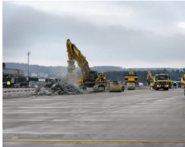
Abbrucharbeiten des bestehenden Betons

Aufgrund der guten Erfahrungen wird dieses Oberbaukonzept seither bei Instandsetzungen und Neubauprojekten konsequent angewendet. Je nach Nutzungsvorgaben und Baugrund kann die Fundationsdicke projektspezifisch angepasst werden. Aus Qualitätsgründen werden,