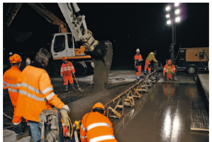
Einbau Schnellbeton (Frühfestigkeit nach 2,5 Stunden: 20\text{ N/mm}^2 )