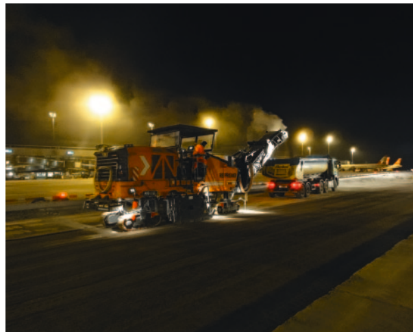
Fräsen der zementstabilisierten Foundation