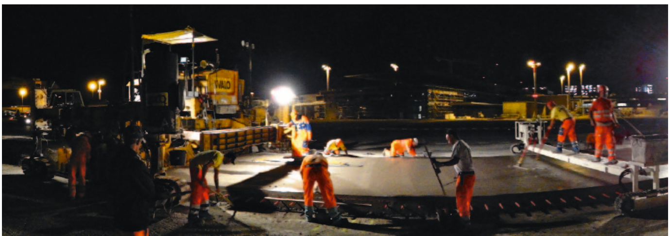
Maschineller Betoneinbau mit Gleitschalungsfertiger