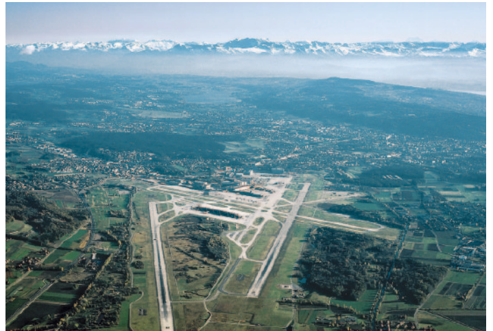
Flughafen Zürich von oben

Mit diesem System kann der Flughafen Zürich die Lebensdauer einer Landepiste um zirka 15 Jahre verlängern. Nach den vorliegenden Erfahrungen hat sich diese Methode ausgezeichnet bewährt.